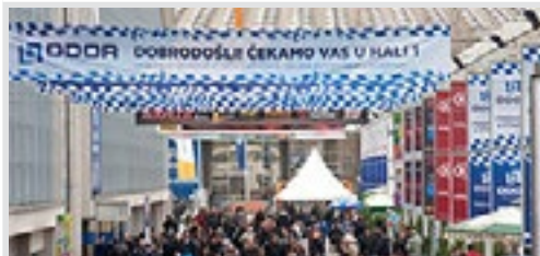
kolonada ispred hale 2, vinil 8x1 m sa 4 bilborda 95x195 cm 55.000 din/kom. kom.