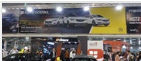
reklamna površina na vinilu, po m 2 3.000 din/m 2