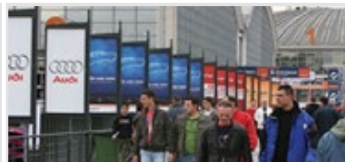
bilbord obostrani na pasareli 95x195 cm, papir 9.900 din/kom. kom.