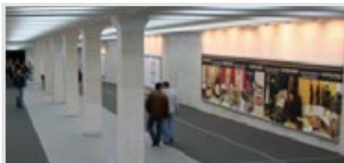
megabord, podzemni prolaz 995x195 cm, papir, osvetljen 48.750 din/kom. kom.