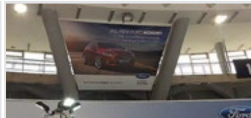
megabord u hali 1, V-baner, vinil, 735x427 cm 96.000 din/kom. kom.