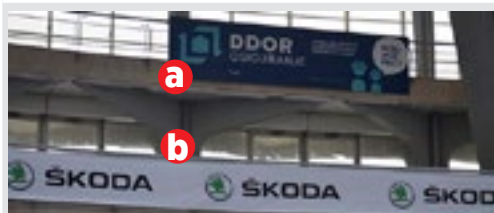
a) pano 6x1.5m kom. 16.000 din/kom. b) vinil na gelenderu iznad štanda kom. 3.000 din/m 2