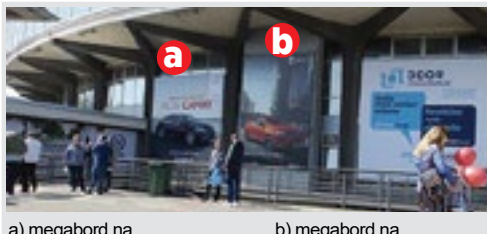
a) megabord na hali 1, 6x6, vinil kom. 150.000 din/kom. b) megabord na hali 1, 4x6, papir kom. 60.000 din/kom.