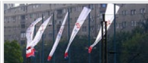
jarbol visina 11 m na bulevaru za zastave do 150x700 cm 10.000 din/kom. kom.