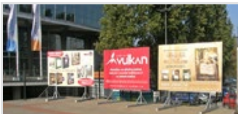
bilbord 300x200 cm, papir 22.500 din/kom. kom.